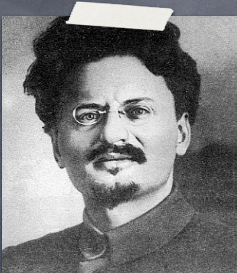
Лев ТРОЦКИЙ (1879–1940)